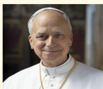
Pape Léon XIV

Le Carême est le temps où l'Église, avec une sollicitude maternelle, nous invite à remettre le mystère de Dieu au centre de notre vie, afin que notre foi retrouve son élan et que notre cœur ne se disperse pas entre les inquiétudes et les distractions quotidiennes. [...]