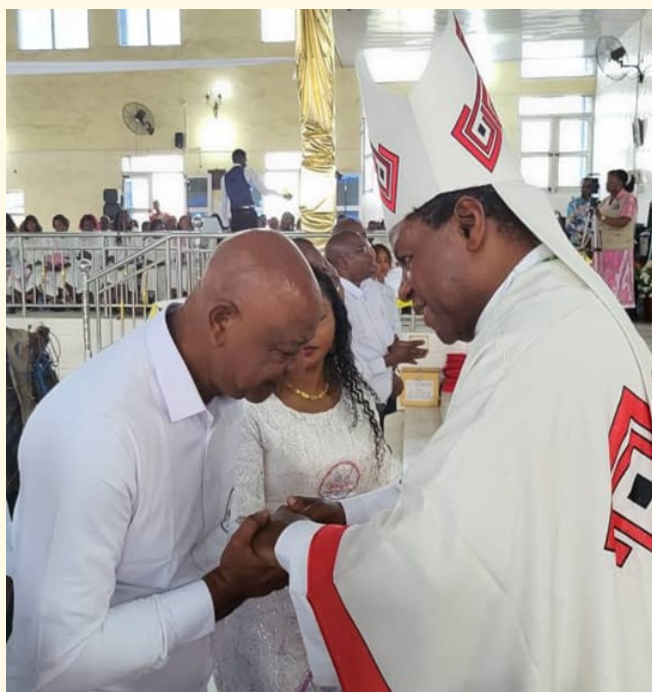
DEVELOPPEMENT ET ŒUVRES SOCIALES : LES AMIS DES MISSIONNAIRES DE JESUS CHRIST

« Noël : marcher ensemble dans la lumière »